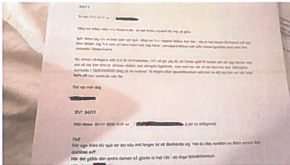
BILD: Fotografi av utskrivet loggtext. Elevens och lärarens namn är överstruken.

För att skriva och läsa loggar måste eleverna respektive lärarna befina sig på en plats där de har tillgång till nätuppkoppling och till digitala redskap. Att använda arbetsplatsens nätverk respektive datorer under APL är inte möjligt för alla elever. Att ha sin egen mobiltelefon framme, under APL framställs som något mycket negativt utifrån intervjuer med handledare, elever och lärare, vilket därmed begränsar elevers möjligheter att skriva logg via sina egna mobiler, även om det skulle finnas en tidslucka mellan olika arbetsuppgifter att göra just det.